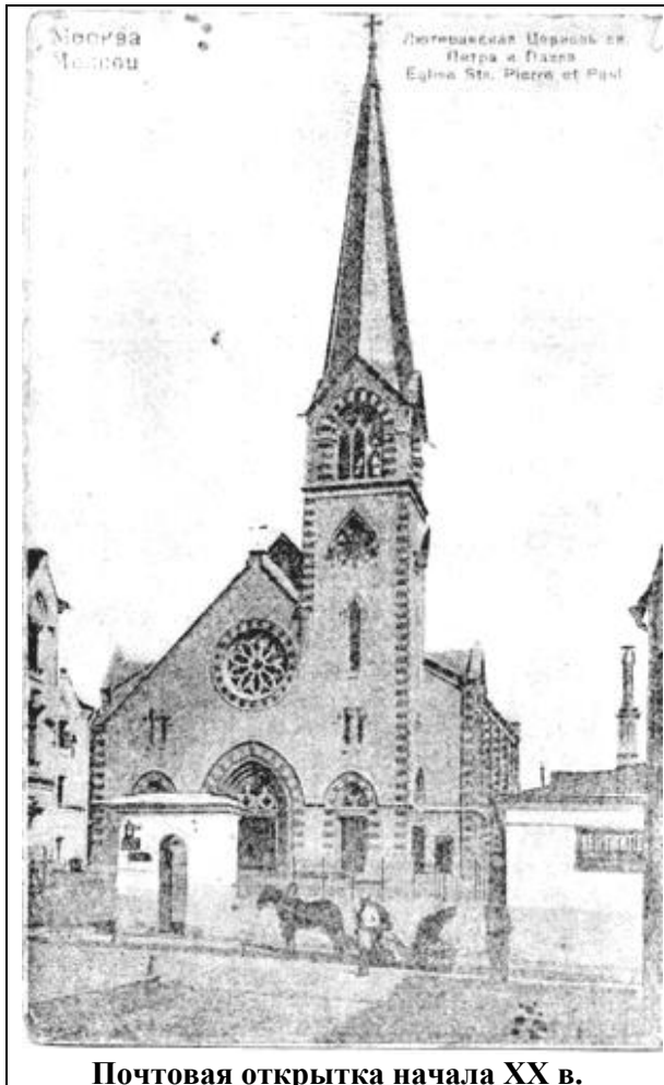
Почтовая открытка начала XX в.