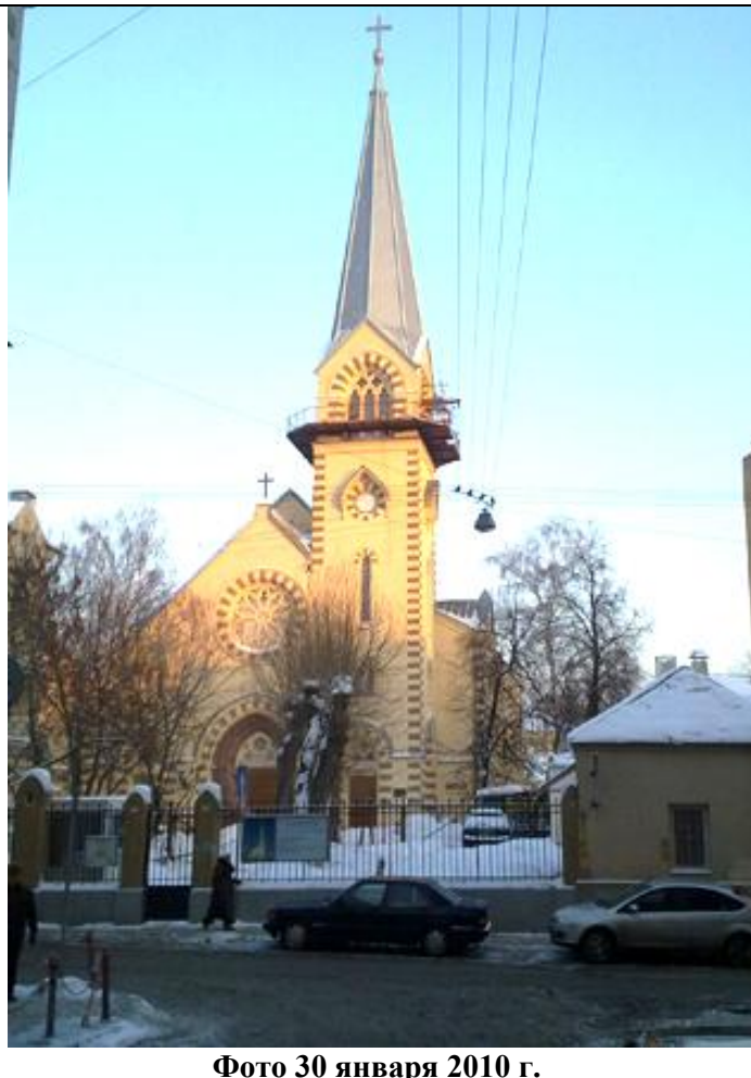
Фото 30 января 2010 г.